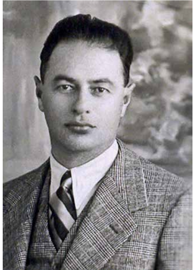
Árpád Weisz (circa 1936).

Weisz kwam in contact met Karel Lotsy, die hem aanbeval bij DFC. Hij werd in Dordrecht aangesteld als trainer en moest de club behouden voor degradatie, hetgeen hem lukte. Op zondag 2 augustus 1942 werd de trainer met zijn vrouw en twee kinderen opgepakt in zijn woonhuis aan het Bethlehemplein in Dordrecht en via kamp Westerbork naar Duitsland