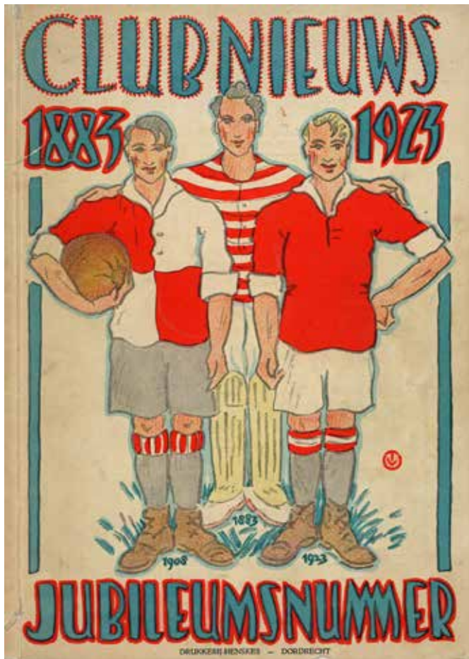
Jubileumnummer DFC uit 1923.