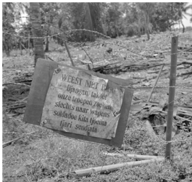
'Weest niet bang. Onze troepen zoeken slechts naar wapens.'

Nemen we een andere plaats: Makassar op Zuid-Celebes. Daar kwam het Nederlandse leger pas in het najaar van 1946 aan. Al in september begon de dag standaard met ochtendgymnastiek voor de opkomende wacht. Al snel organiseerde de meegekomen officier, medeverantwoordelijk voor sport en verplicht aanwezig bij elke legereenheid, atletiekwedstrijden in het centrum van de stad. Voetbal werd veelvuldig beoefend: tegen bestaande clubs, maar ook tegen clubs van bezoekende schepen. 17 Eind 1946 kende Makassar een bloeiend en actief sportleven.