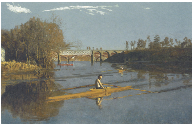
Thomas Eakins: 'The Champion Single Sculls (Max Schmitt in a Single Scull)', 1871, olie op linnen, 81,9 x 117,5 cm. Collectie Metropolitan Museum of Art in New York.

Kunst met sportmotieven gebruiken om sport beter te leren kennen is slechts een van de doelen die Allen Guttman met zijn boek Sports and American Art wil verwezenlijken. Tegelijk wil hij demonstreren dat kennis van de sportgeschiedenis bijdraagt aan het waarderen van op sport betrokken kunst. Als ander hoofddoel wil hij aantonen dat de ontwikkeling van