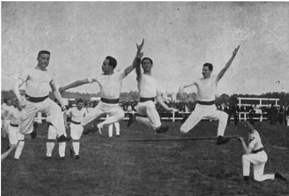
Zweedsche Gymnastiek door Belgische militairen. — Sportwedstrijden te 's-Gravenhage, Juli 1910.