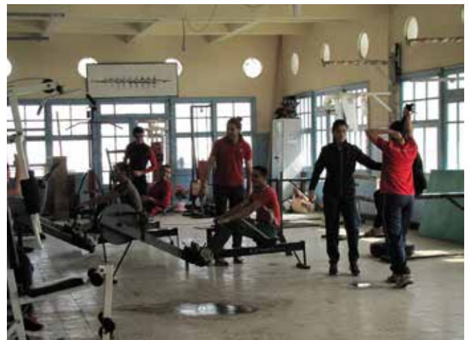
Fitness in het clubgebouw van de Sport Nautique, maart 2013.

Een derde voorbeeld van groots opgezette spektakels vindt plaats in mei 1950, als de Darse in de ban is van een ‘bataille de fleurs nautique’. Beelden uit het filmjournaal ‘Les Actualités Françaises’ tonen een afgeladen haven en massaal toegestroomd publiek. 15 De betekenis van de SNA in het oude havenhart van Algiers is dus belangrijker dan alleen maar een clubgebouw met activiteiten, ergens aan de rand van een stad. Deze verbinding tussen stad, stedelijke gemeenschap en club blijkt ook uit de aanwezigheid van een reddingsloep. 16 In de herfsttij van de Franse koloniale aanwezigheid neemt het aantal watergerelateerde sporten toe, waaronder zwemwedstrijden in open water (1949), het eerste kampioenschap onderwatervissen (‘chasse sous-ma-