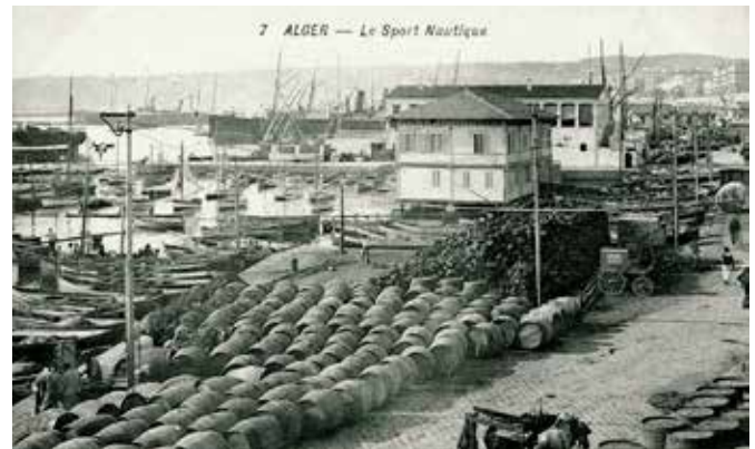
Ansichtkaart van het clubgebouw in de Darse.

De Sport Nautique d'Alger (SNA) is de ouderling onder de nautische sportclubs. De vereniging dateert van 1867. In deze periode staat westerse sportbeoefening in de kolonie nog in de kinderschoenen. De Franse bezetter besteedt zijn vrije tijd aan jacht- en schietsport, paardenraces en gymnastiek. Tot de eerste verenigingen in Algiers behoren een 'Société de Tir' alsook 'Club de Gymnastique'. Enkele decennia later komen andere disciplines uit Europa overwaaien, zoals wielrennen; de eerste wielclub, Véloce-Club d'Alger, dateert uit 1888.