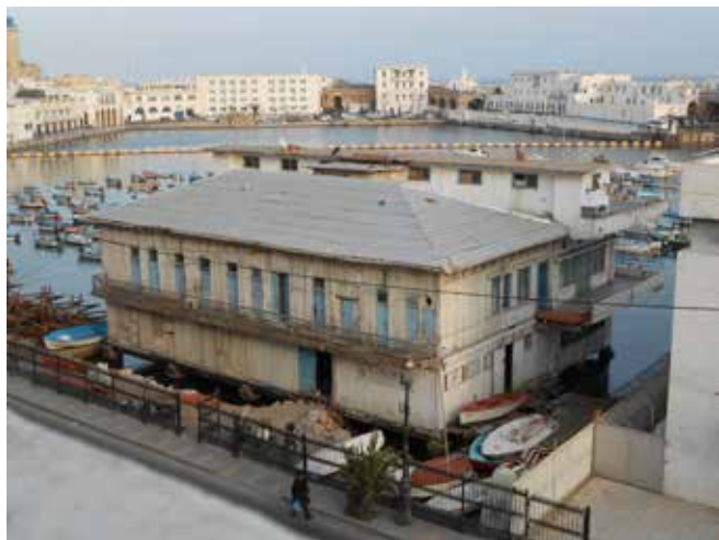
Het gebouw van de Sport Nautique d'Alger in 2015. Het oorspronkelijke houten clubhuis en de betonnen achterbouw zijn duidelijk te zien.

van de verschillende bevolkingsgroepen, met gemengde verenigingen als norm.