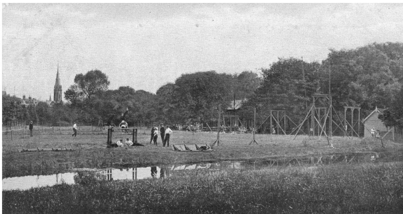
Sportterrein met 'gymnastische toestellen' in het Vondelpark rond 1890 (ansichtkaart uit de privécollectie van Theo Bollerman in Den Haag).

De Olympia Vereeniging slaagt erin aardig wat publiciteit te genereren. Het tijdschrift Olympia start in 1883. Bientjes publiceert een aantal van zijn bijdragen in een bundel onder de geuzentitel Tirailleursvuur. Uit een paedagogisch en letterkundig kamp . Er zijn zowel ironische als welwillende reacties op de ideeën en activiteiten van de beweging. Op de iets langere termijn echter, hoewel er meerdere berichten zijn van en over plaatselijke afdelingen, is het alleen in Amsterdam dat de Olympia Vereeniging met enig structureel succes actief is. Hier