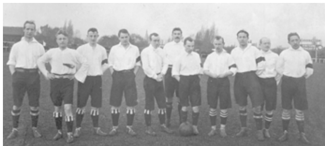
Het Belgische journalistenteam? De oudere personen in het team lijken erop te wijzen dat dit geen gewoon elftal was. Bovendien werd de foto getrokken op het veld van Antwerp F.C., waar de journalisten gewoonlijk hun wedstrijden speelden.

derlandse voetbalwedstrijd voor militairen. Misschien komt hier het idee voor het eerst naar voren om ook zo'n derby der Lage Landen voor journalisten te organiseren? 11 In Nederland experimenteren journalisten (hoewel daar niet alleen sportreporters bij zijn) in dezelfde periode met het oprichten van een gelegenheidselftal. 12 Zowel in die vroege wedstrijden als in de Belgisch-Nederlandse ontmoetingen is niet alleen de wedstrijd zelf van tel. Na negentig minuten competitie volgt altijd een gezellig groepsdiner, doorspekt met speeches van beide partijen. Een ideale gelegenheid om elkaar beter leren te kennen en een band te smeden. Die socialiserende functie wordt nog versterkt door de lollige sfeer van 'jongens onder mekaar' die rond elke wedstrijd hangt. Zo moet er bij de derby van 1912 nog snel-snel naar een scheidsrechter worden gezocht onder de aanwezigen, en luisteren een aantal collega-journalisten het wedstrijdverloop op door enthousiast te supportereren. 13