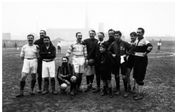
Een groepsfoto van de Franse journalistenploeg uit de vorige afbeelding

Terwijl hun beroep stilaan de kinderschoenen ontgroeit, beginnen veel sportjournalisten ook interesse in elkaar te tonen. Sportjournalisten komen vaker en vaker samen in de marge van hun beroepsbezigheden. Om zich te vermaken en met elkaar te praten, maar ook om ervaringen te delen of over gemeenschappelijke problemen te spreken. Zo komt een beroeps cultuur tot stand. Praktijken als voetbalwedstrijdjes spelen tegen collega's van over