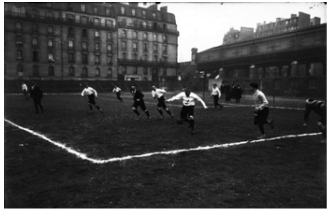
Vriendschappelijke wedstrijden tussen teams van sportjournalisten waren niet beperkt tot de Lage Landen. Hier zien we een ploeg van Franse reporters spelen tegen een team van de Engelse krant Daily Mail , in Parijs in 1908.

gaan met de eerste gespecialiseerde sportbladen. Die laatste zijn nog vaak huis-tuin-en-keukenwerk, met een lezerspubliek van niet meer dan enkele tientallen of honderden jonge sportfanaten. Sneller in de jaren 1890, wanneer de wielersport aan populariteit wint en de Belgische krantenindustrie voor het eerst brood in het nieuwe fenomeen 'sport' ziet. Het aantal nieuwe sportbladen loopt al snel in de tientallen – hoewel de meeste ervan het niet lang uithouden. In 1893 verschijnt zelfs een eerste sportief dagblad, het Brusselse Le Véloce . Een paar jaar later krijgt dit blad het gezelschap van een Antwerpse collega: Le Rush .