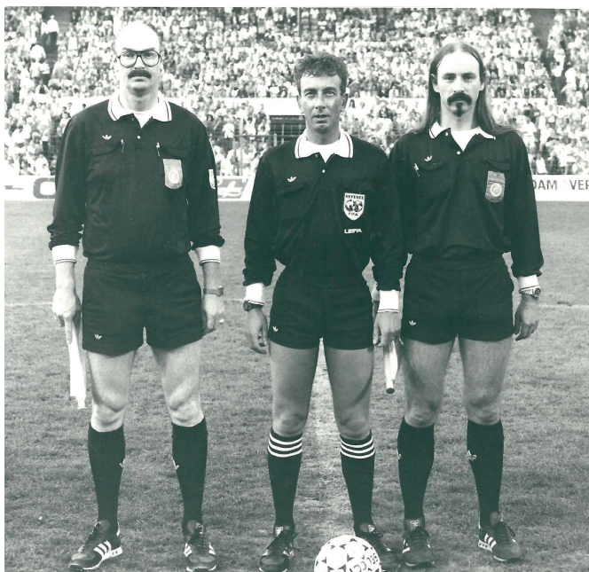
John Blankenstein, geflankeerd door twee grensrechters. Bron: besproken boek.

John Blankenstein kon zelf niet voetballen, maar was wel een internationale topscheidsrechter. Bovendien was hij openlijk homoseksueel, wat in het topvoetbal een zeldzaamheid was en is. Een mooie combinatie voor een biografie.