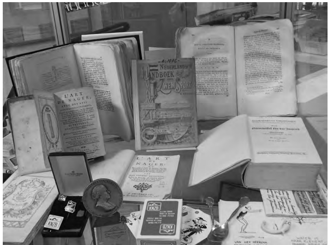
Detailfoto van de vitrine, met in het midden het boek van D. Vrijdag