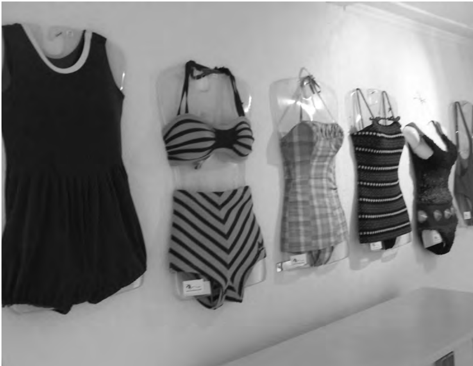
Deel badpakkenlijn van collectie 1850 tot heden.