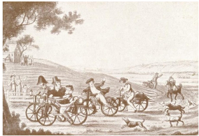
Een wedstrijd met draisines, een loopfiets met stuurmechanisme, uitgevonden (1817) en vernoemd naar de uitvinder ervan: Karl Freiherr von Drais von Sauerbronn.

Ook voor het Zeeland van de jaren dertig van de negentiende eeuw ging dit verschijnsel op, aldus Willem Polman Kruseman in zijn boek Zeeland van 1813 tot 1913 . 6 In een hoofdstuk over de ontwikke-