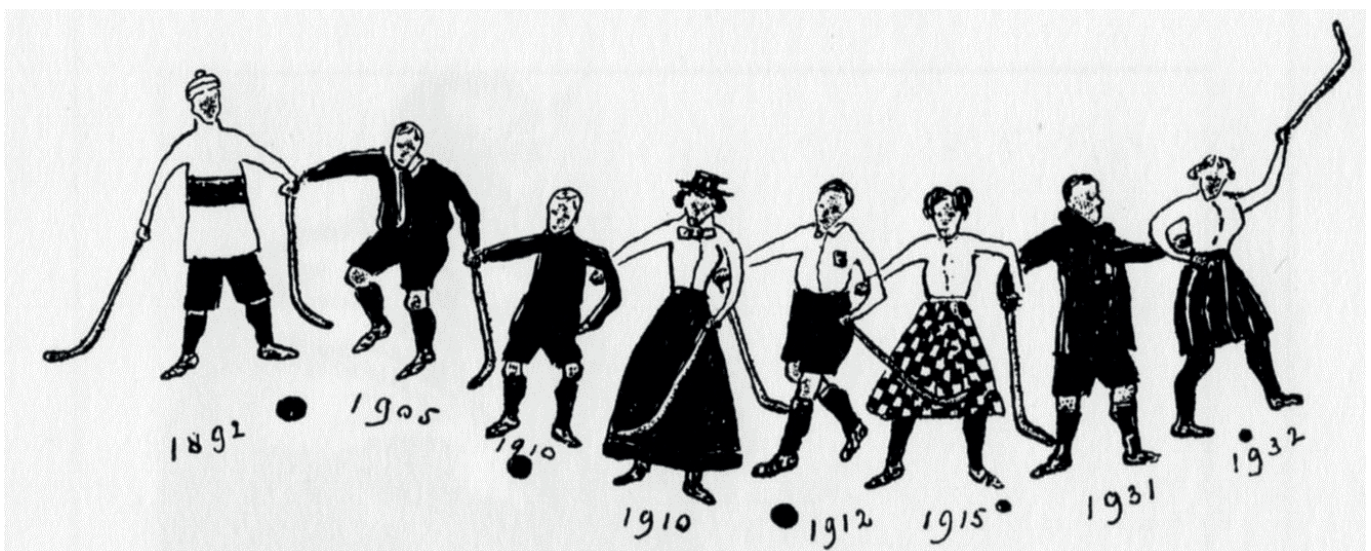
De Amsterdamsche Hockey en Bandy Club 1892-1932. Bron: ‘Gedenkboek der Amsterdamsche Hockey- en Bandy Club. Uitgegeven ter gelegenheid van het 40-jarig jubileum, 1892 – 28 januari – 1932’. [Amsterdam: s.n.], [1932].