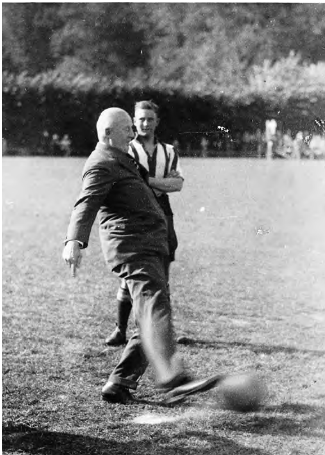
Pim Mulier trapt het gouden jubileum van de KHFC in 1929 af.

Vele van de seculiere preoccupaties, die velen benauwden in het fin de siècle , tuimelen in dit warrig overkomende citaat over elkaar heen: industriële sleur, decadentie, volkskracht, oorlogvoering, militaire en koloniale macht, pacifisme, socialisme en pastoralisme. Sport wordt in deze onberekenbare wereld aangeprezen als een fundamenteel redmiddel voor de natie; een aanspraak waarmee ook bijvoorbeeld het gymnastiekverbond en de ANWB hun onmisbaarheid onderstreepten. Essentieel in Muliers optiek is de betrokkenheid van de hele natie. Alle landstreken en alle bevolkingslagen moesten in één of andere vorm sport beoefenen. Dit veronderstelde onvoorwaardelijke democratisering, maar daarvoor was Mulier te sterk paternalistisch ingesteld.