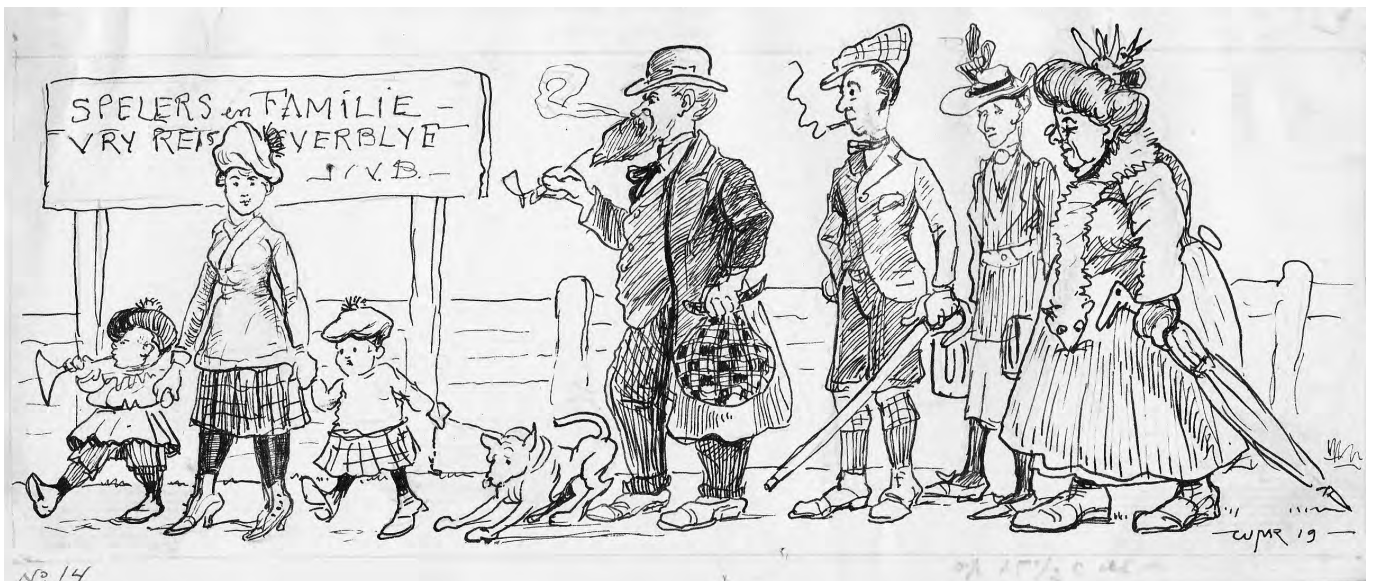
Het verkapte professionalisme. Tekening ten behoeve van het Gedenkboek HFC 1879-1919, Oost-Indische inkt op papier.

'De heer W.J.H. Mulier bijv. geeft proeven van pen-teekeningen, die voor de voortbrengselen der beroepstekenaars in onze geïllustreerde bladen waarlijk niet behoeven onder te doen. Want dit moet men wel bedenken bij het beoordelen van het werk, dat de redactie uitsluitend bestaat uit mannen, die uit liefhebberij pen en potlood hanteren.' 6