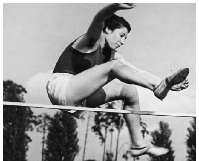
Links: Babe Zaharias, boven: Gretel Bergmann