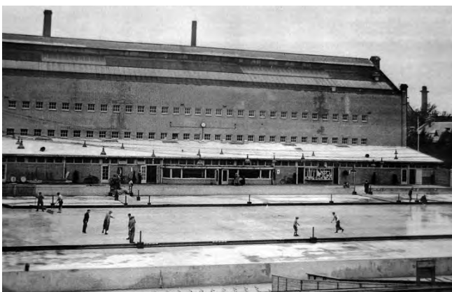
De Linnaeusstraat 1935

De tweede 400 meterbaan was die van Squaw Valley in Californië, aangelegd voor de Olympische Winterspelen 1960. Vanwege de hoge ligging op 1890 meter en de goede ijskwaliteit regende het hier records. De Noor Knut Johannesen verpulverde het acht jaar oude wereldrecord van Hjalmar Andersen op de 10.000 meter met maar liefst 46 seconden! Hij was daarmee de eerste schaatser die de 16 minutengrens doorbrak! Anno 2009 zitten al 20 seconden onder de 13 minuten! De installatie werd in 1966 overgeplaatst naar West Allis.