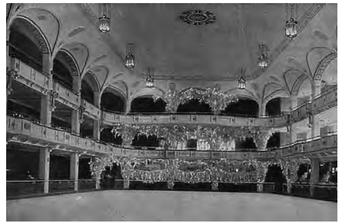
Das Berliner Eispalast