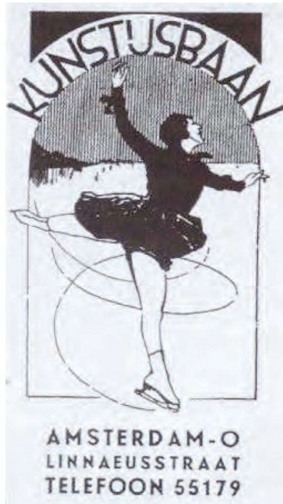
Een reclamefolder voor de Linnaeusstraat

Technisch gesproken was de Jaap Edenbaan in 1961 een hoogstandje van koeltechniek, omdat het de eerste 400 meterbaan ter wereld was met verdampende ammoniak in de koelbuizen. Dit leverde een energiebesparing van circa 25 % op ten opzichte van de twee eerder gebouwde banen, die indirect werkten op pekel, koud gemaakt met Freon 22.