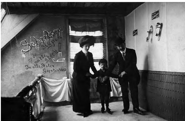
Schaatsen op de zolder van Odeon

De bekende architect Cuypers ontwierp eind 1800 wel een groot rechthoekig gebouw voor de ijsbaan Noordpool, met in het midden een café en daaromheen de schaatsbaan. Rondom de baan had hij een wandelgalerij ontworpen, een veel gebruikt principe bij ijsbanen indertijd. Het exterieur van de ijsbaan was oosters, met hoektorens en uivormige koepels bij de entreepartij. Deze vormgeving verwees naar woestijnvolken en hun ervaring met het koel houden van hun gebouwen bij hoge temperaturen. Ook paste Cuypers veel houtwerk toe, dat verwees naar bergvolkeren. Het gebouw had een onderbouw in baksteen en (giet)ijzeren spanten. Vermoedelijk was het gebouw gedacht op het Museumplein, waar twee ijsverenigingen terreinen