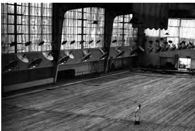
de Vloer van de baan in de Apollolaan

De Apollohal was in 1940 trouwens niet de eerste overdekte kunstijsbaan in Nederland, want eind oktober 1937 was de HOKIJ geopend: de Haagse Overdekte Kunst Ijsbaan. Tilburg kreeg in 1938 een open baan (52