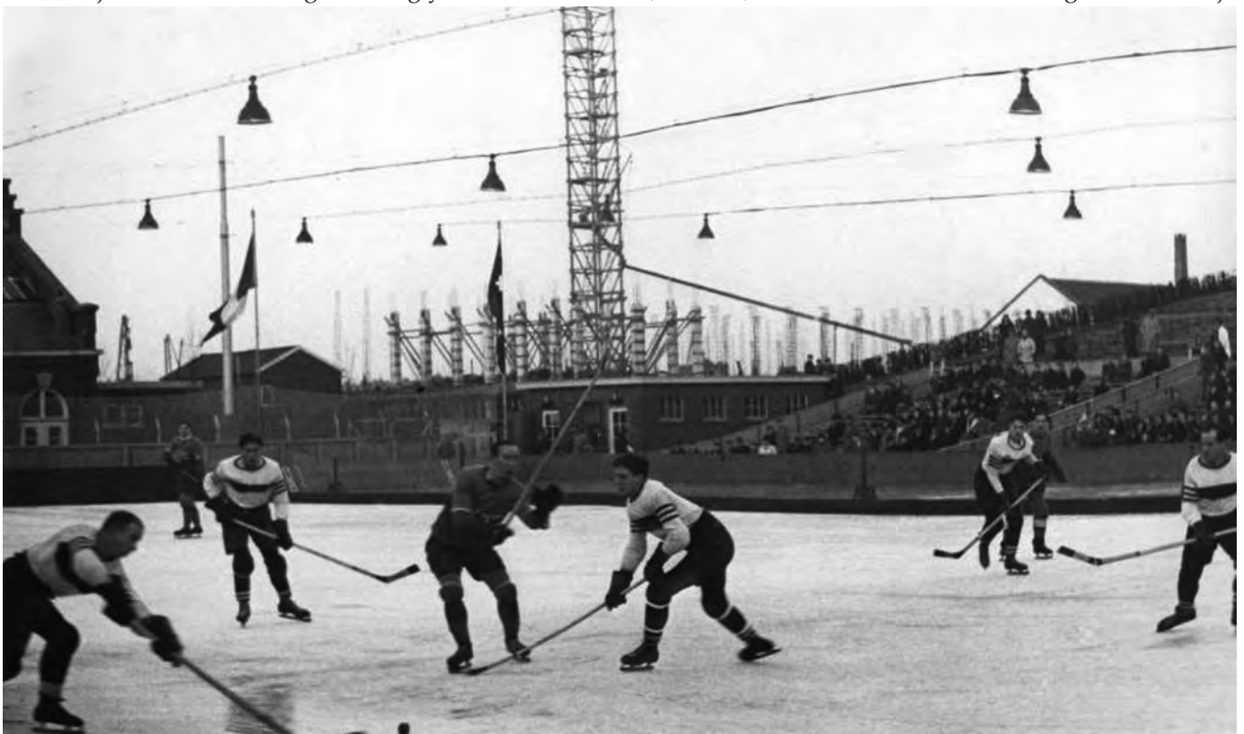
Ijshockey in 1934

Dit principe – het rondpompen van koude vloeistof door een pijpsysteem – vond al snel elders weerklink. Schaatsen werd erg populair en gezien als gezond en vooral beschaafd vermaak. In vele grote steden verrezen er ijshallen met steeds groter wordende ijsvloertjes, vaak omgeven door balustrades waar dan een orkest speelde, luxueuze inrichting en prachtige namen als Eispalast en Palais de Glace. De eerste baan (532 m 2 ) op het Europese vaste land kwam in Frankfurt (1881), in hetzelfde jaar openden ook twee ijsbanen in Hamburg, en de stad Berlijn kreeg haar eerste Eispalast in 1908 (1900 m 2 ) gevolgd in 1910 door het Sportpalast (2500 m 2 ) en daarna in 1911 ook nog het werkelijk