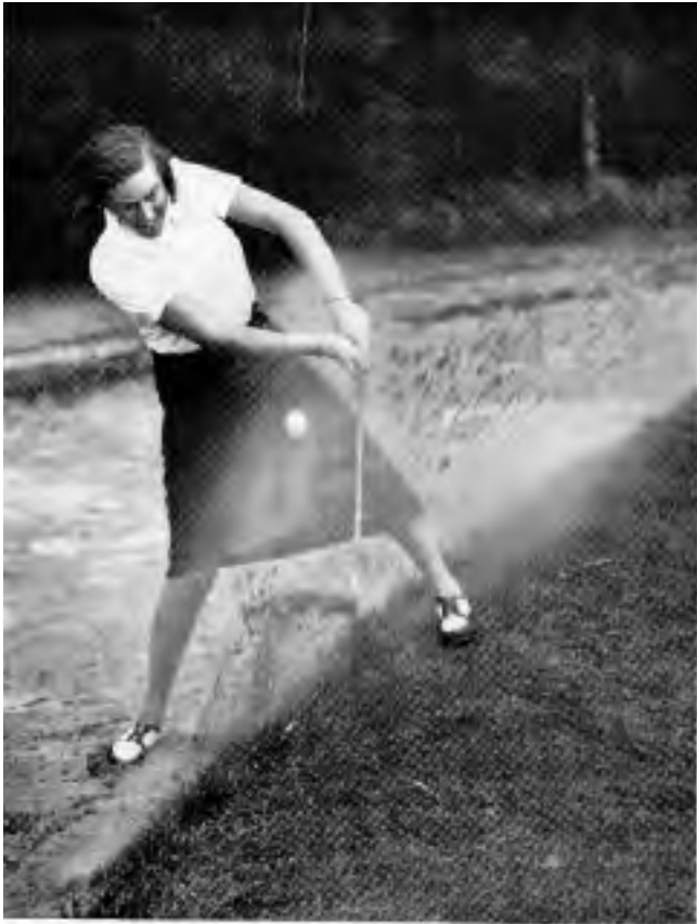
Een explosie-slag. Zoo wordt de bal uit de zwakte rondtrek bevestigd.