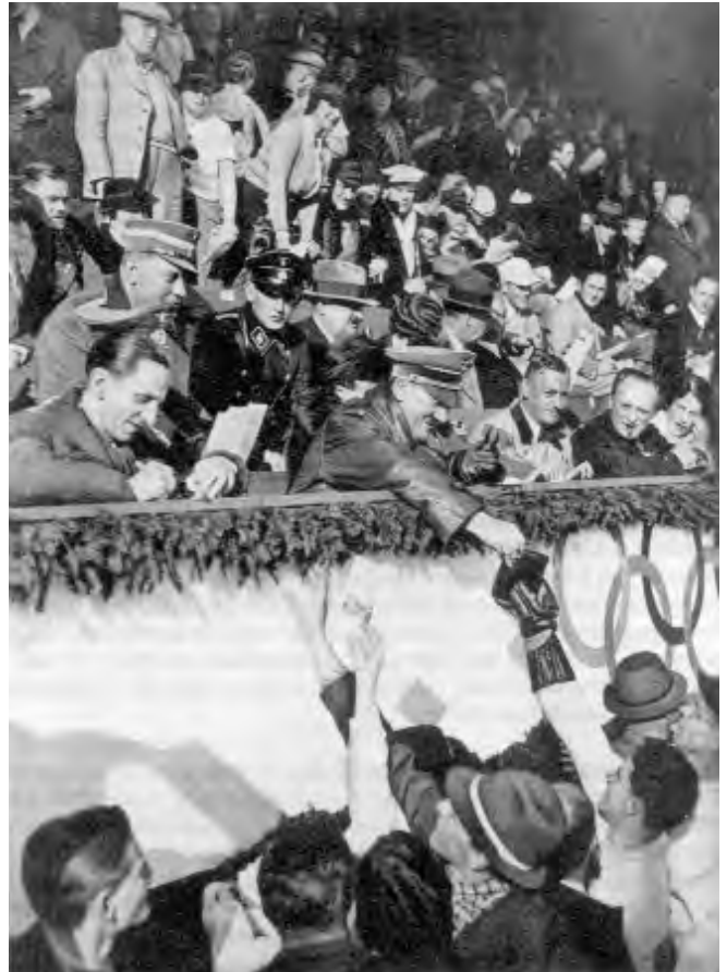
Adolf Hitler deelt handtekeningen uit aan Canadese ijshockeyers.

Volgens Spielberg is het één overigens niet beter dan het ander. Hoogstens anders. Daarom zegt de ene sporter (Volkskrant 26.1.2006 ) over Munchen 1972: "Het was als een ongeval op de Autobahn. De politie en ziekenauto's staan erbij en jij rijdt verder", en zegt de ander "Ik was geschokt. Ik vond het niet gepast door te gaan met hockey op een festijn waar elf doden waren gevallen".