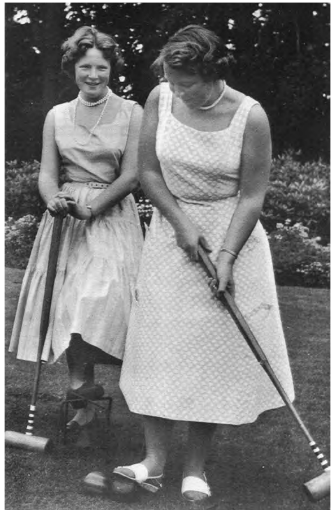
Ok koningskinderen beoefenen croquet. Prinses Beatrix staat op het punt de croquetslag toe te passen (waarbij ten tijde van de foto nog de voet op de eigen bal werd gezet). Pieter Reinier Dingemans van de Kastele besteedt maar liefst 16 spelregels aan dit essentiële onderdeel van het croquet. (Met dank aan de Rijksvoorlichtingsdienst voor zijn toestemming tot publicatie.)

7 juni 1885 te Zwolle geboren als zoon van Ir. B. Van der Pot en J.G. De Voogt. Zij oudere broeder was de bekende hoogleraar in het Staatsrecht. De familie Van der Pot-De Voogt bewoonde vele jaren lang in Zwolle de villa "Overenk" aan de Wipstrikker Allee, toen nog een stille buitenwijk. Het huis lag in een lommerrijke tuin, waar men zich 's zomers met het vriendelijke croquetspel placht te vermaken. Het was een ouderwets gezin, drie zoons en drie dochters, dat volkomen in de deze entourage van de "Camera Obscura" paste. xxv Je zou je zo bij het gezelschap 'met een geheel eigen fijne humor' hebben willen voegen. En zelfs als patiënt moet een verblijf in het Badhotel te Baarn, 'het internationaal befaamde ontspannings- en kuuroord' bepaald plezie-