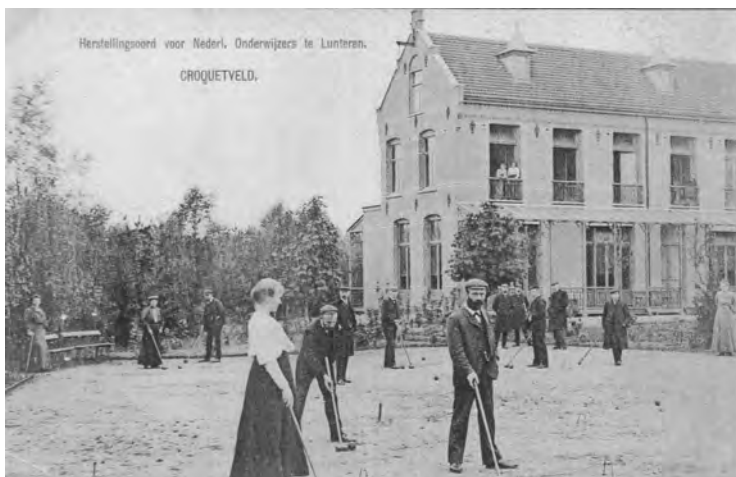
Onderwijzers en onderwijzeressen samen aan de bal in Lunteren (poststempel 1910).

Ik heb hiervoor op basis van het merendeel van mijn bronnen regelmatig over croquet als spel geschreven. Daarin diende croquet ter vermaak, ontspanning, heling en, last but not least, het had een sociale functie: bindmiddel tussen ouders en kinderen, tussen mannen en vrouwen. xxxi Toch was het aan het eind van de negentiende eeuw niet helemaal alleen maar een spelletje zoals de verenigingen Vrijheid Blijheid en Lycurgus in Deventer respectievelijk Sneek bewijzen. Maar anders dan bijvoorbeeld bij cricket - dat in Nederland immers ook steeds een marginale positie heeft gehad - heb ik in de door mij beschreven periode geen aanwijzingen kunnen vinden voor ontmoetingen met andere clubs, met andere woorden er was geen competitie. Croquet moet daarom in de introductieperiode als spel, vermaak worden beschouwd. Ik heb de periode daarna niet onderzocht, maar het lijkt erop dat croquet ook dan nooit een serieuze competitie sport is geworden. Daar veranderen een zekere democratisering van het spel xxxiii . Croquet is in Nederland allereerst spel gebleven. xxxiiii