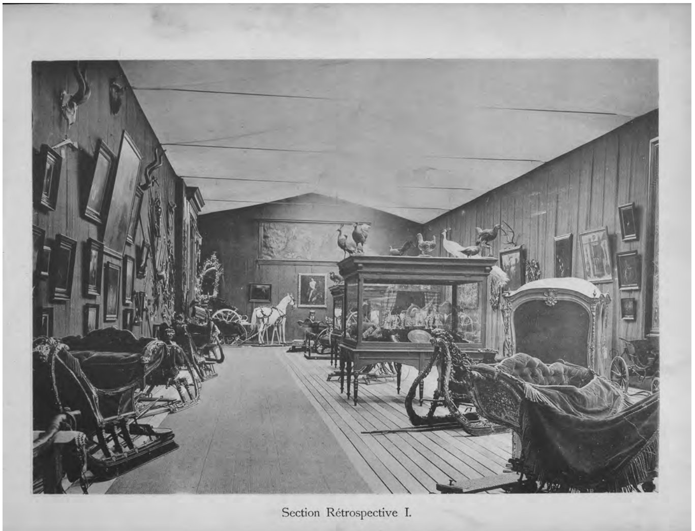
Section Rétrospective I.

Ik geef nu eerst een zo volledig mogelijk beschrijving van het wedstrijdprogramma. Dat is met name gebaseerd op de uitvoerige, onderdeelsgewijze beschrijving daarvan in het al meermalen aangehaalde (officiële) Verslag der Internationale Sport-, Visscherij- en Paardententoonstelling te Scheveningen van 1 Juni tot 2 October 1892 van Wijbrandus Travaglino. Een enkele keer vul ik de gegevens aan met informatie uit andere