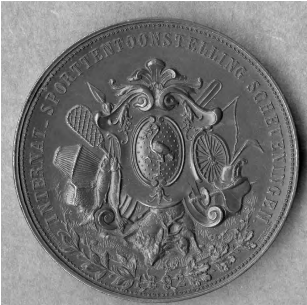
Herinneringsmedaille t.g.v. de ISVP. Op de medaille zijn rondom het Haagse wapenschild zowel attributen van traditionele vermaken (bijvoorbeeld jacht, paardensport en visserij) als moderne sporten (bijvoorbeeld cricket, tennis en schermen) te zien. Collectie: Pieter Breuker