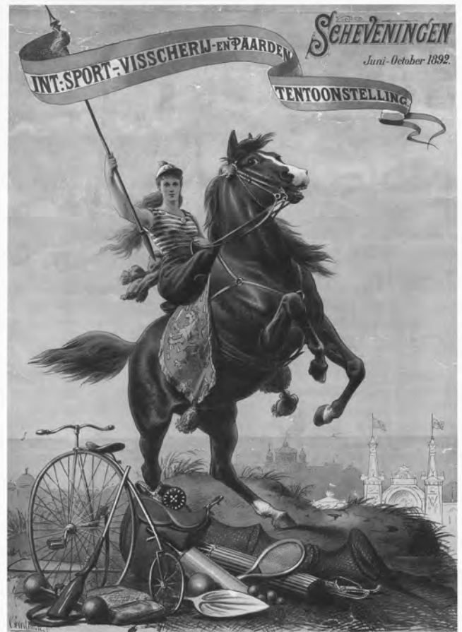
Affiche van de ISVP, gemaakt door Otto Eerelman.

Met de opkomst van de georganiseerde sport in de tweede helft van de negentiende eeuw en de entree van Engelse sporten werd ook sport regelmatig onderwerp van de heersende tentoonstellingsdrift. Een kleine zoektocht in het digitale krantenarchief van de KB of van de Leeuwarder Courant (die vanaf 1752 onafgebroken verschijnt) laat zien dat er in genoemde periode herhaaldelijk sporttentoonstellingen zijn geweest. Ik beperk me hieronder tot enkele voorbeelden, bovendien uitsluitend uit de jaren net voor de ISVP. Het gaat daarbij om exposities in de eigenlijke zin van het woord, zoals de internationale sporttentoonstelling te Amsterdam in 1888, of om een combinatie met sportwedstrijden, zoals bijvoorbeeld de nationale sporttentoonstelling van 1888 te Nijmegen of de internationale