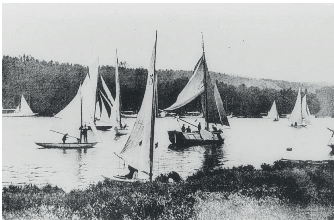
Zeiljachten uit diverse klassen bij de open wedstrijd op zondag 20 mei 1900 op de Seine bij Meulan.

geheel te vol eindigen. De uitslag was [...] 3-10 ton, 1 Bona [F]ide van Howard Taylor (Eng.), 2 Turquoise van Michelet (Fransch). Mascotte werd ditmaal vierde, achter Gitana (Frankrijk), Frimouse (USA) en na diskwalificatie van het Franse jacht Turquoise , dat nog voor Mascotte over de finishlijn was gevaaren. 2