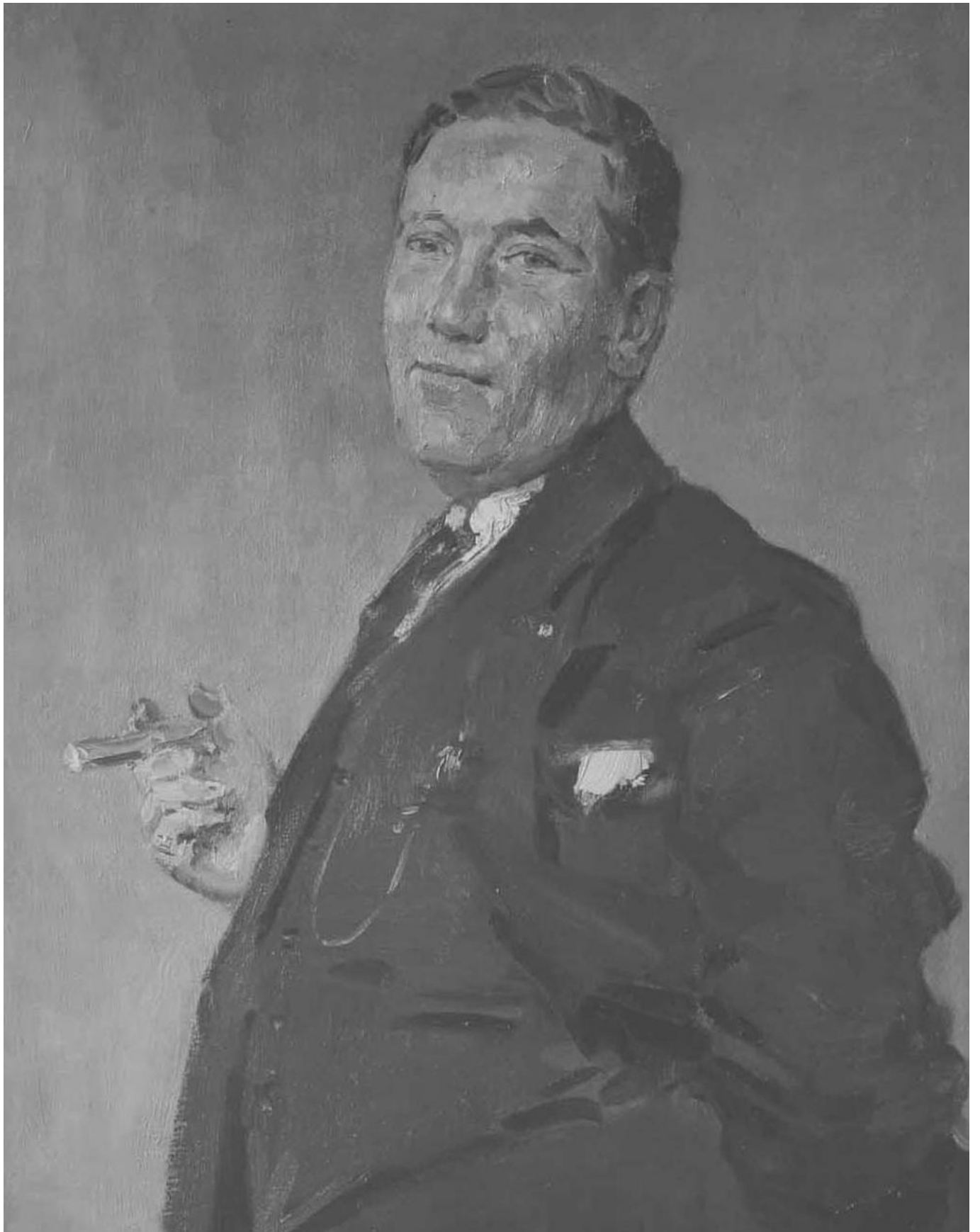
Architect Jan Wils.