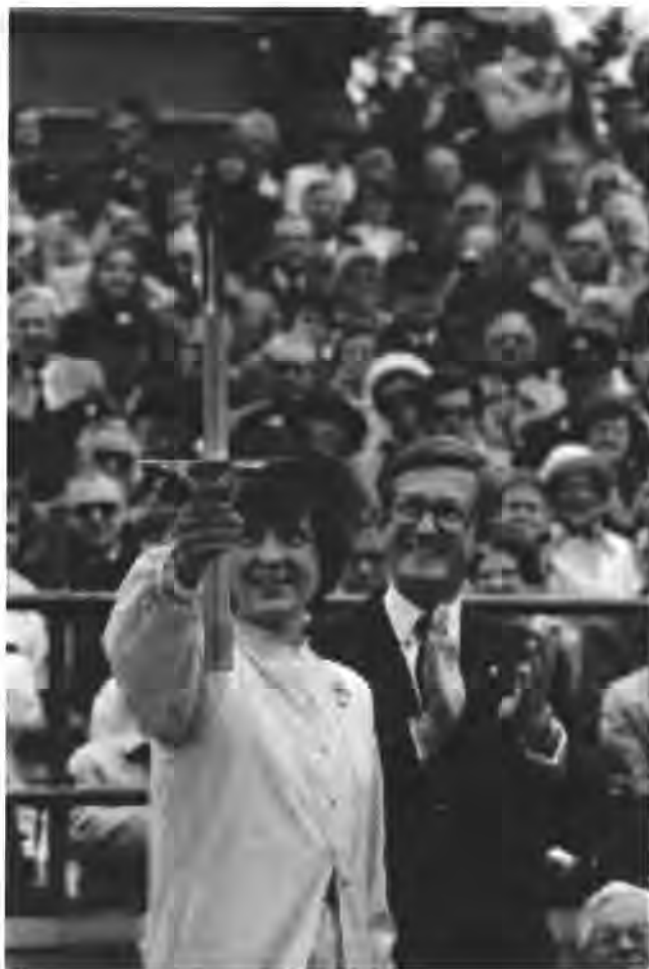
Afbeelding 4 Opening Olympische Spelen voor Gehandicapten in Arnhem; HKH Prinses Margriet met fakkel, naast haar mr. Pieter van Vollenhoven

Nederland was, zoals hiervoor beschreven, inmiddels een bekend gezicht op de Paralympische Spelen. In bestuurlijk opzicht is dit ook het geval. Nederlanders