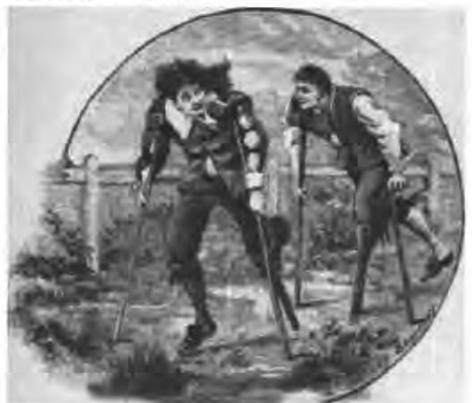
Afbeelding 1 Cross country wedstrijd voor kreupelen, omstreeks 1880

Sport als een vorm van vrije tijdsbesteding voor gehandicapten komt pas in beeld aan het begin van de vorige eeuw. Sport en spel worden dan in eerste instantie in aangepaste vorm toegepast binnen (para)medische instituties, voornamelijk hospitalen en revalidatiecentra. Naast het gebruik van sport- en spelvormen als behandeltherapieën worden die ook in het kader van recreatie en dagbesteding binnen de instellingen ingezet. Maar eigen verenigingen of organisaties waar patiënten, eenmaal terug in de samenleving, kunnen sporten of recreëren, zijn er niet voor mensen met een beperking. De aard van de beperking speelt daarbij natuurlijk ook een rol.