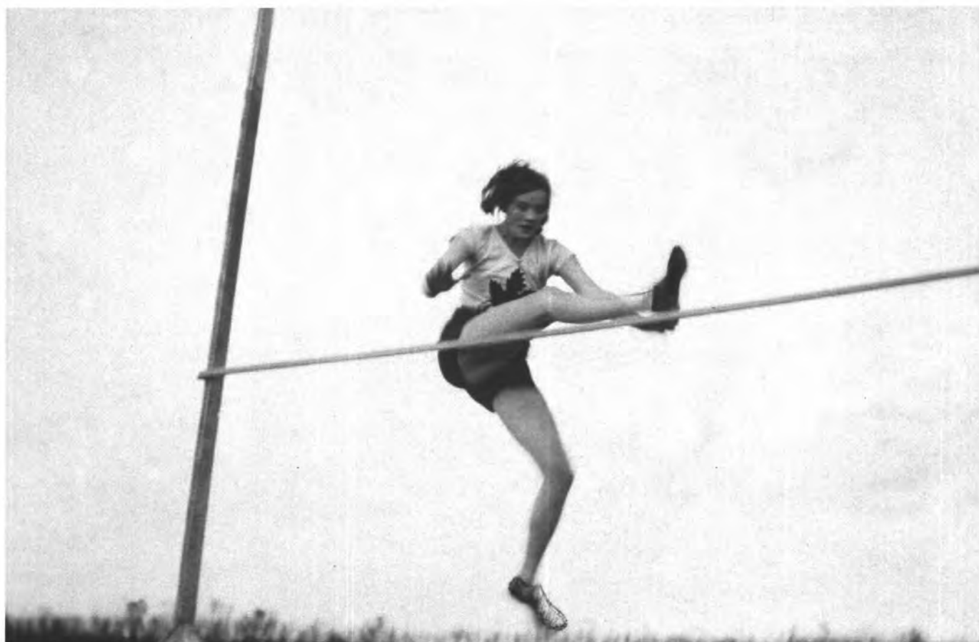
Ethel Catherwood (Canada) wint met 1,59 m goud op de Olympische Spelen van 1928 in Amsterdam