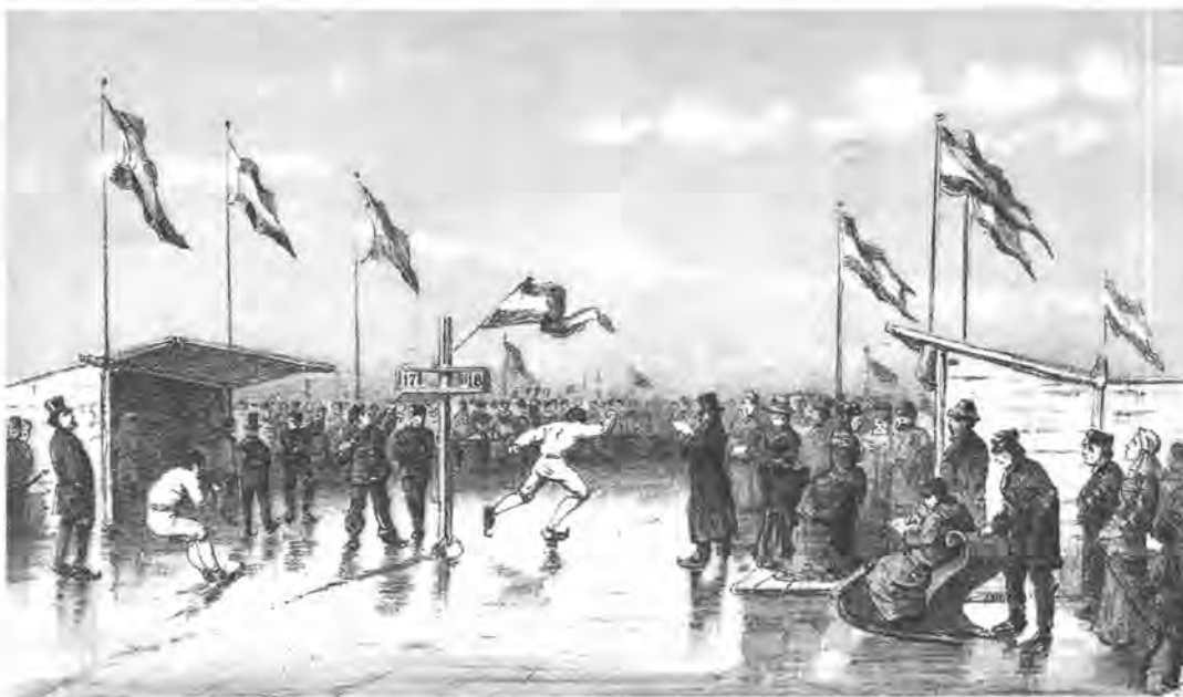
Afbeelding 1 Benedictus Kingma verslaat de Engelse 'Champion' George Smart tijdens de 'Internationale Hardrijderij op Schaatsen te Leeuwarden 28 Januari 1885'. (Illustratie uit Nederlandsch Handboek voor Ijs- sport van S.H. Hijlkema - Amsterdam 1887)

Toch bleken de Friese kortebaanrijders op het dooi-ijs van de Grote Wielen geen moeite te hebben met de Engelse concurrenten. Maar de euforie rond de Friese successen duurde niet lang. Vooral buiten de provincie - en zeker in bondskringen - werden de kortebaanmatoren er niet populairder op toen al vrij snel bekend werd dat de laatste acht rijders vooraf onderling hadden geloot wie de winnaar zou worden. De langebaanleiders van dat moment trokken hun eerste conclusies.