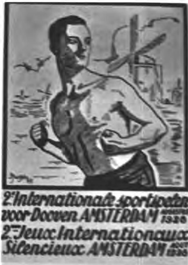
Afbeelding 2 Poster van de 2de internationale sportspelen voor dooven, 1928

Mensen met een auditieve beperking hebben vergeleken met hun gehandicapte lotgenoten, iets makkelijker toegang tot de samenleving en bepaalde voorzieningen. De motorische basisvaardigheden van veel sporten vormen voor hen niet de grootste drempel voor sportdeelname. Hun handicap openbaart zich vooral in de onderlinge communicatie en een niet passende regelgeving van de sport. Vanuit de eind 19 de eeuw opgerichte doveninstituten in ons land ontstaan er in verschillende steden (o.a. Amsterdam en Rotterdam) ontspanningsverenigingen waar ook sporten als voetbal, biljart en zwemmen beoefend worden. Een doorbraak in de georganiseerde sport voor dooven vormde de deelname van enkele sporters uit Nederland aan de eerste internationale spelen voor dooven. Die spelen werden in Parijs in 1924, aansluitend op de Olympische Spelen gehouden. De Nederlandse deelnemers aldaar waren zeer enthousiast over het evenement en boden aan de volgende editie, vier jaar later in Amsterdam, te organiseren. Dat zou op een soortgelijke wijze als in Parijs na afloop van de Olympische Spelen kunnen