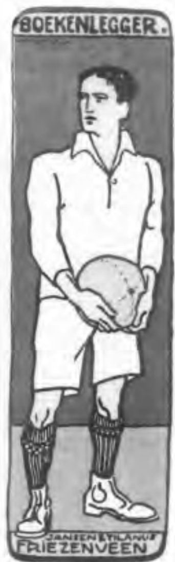
Boekenlegger voor sportkleding van Jansen en Tilanus