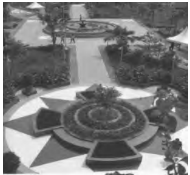
Taman Menteng op de plaats van het oude stadion

Bij uw volgende visite aan Jakarta kan nu een bezoek gebracht worden aan het hypermoderne park Taman Menteng, vlakbij Galery Keris, een groene high-tech oase in het door auto's en motoren verstikte centrum. De meeste inwoners van dat centrum zullen wel blij zijn met deze plek, waar ze op zondagmorgen hun gymnastiek oefeningen kunnen afwerken en hun bubur ayam kunnen eten. Het enige dat nog herinnert aan de oude bestemming is een soort kunstwerk. De historici hadden weer eens knarsetandend het nakijken!