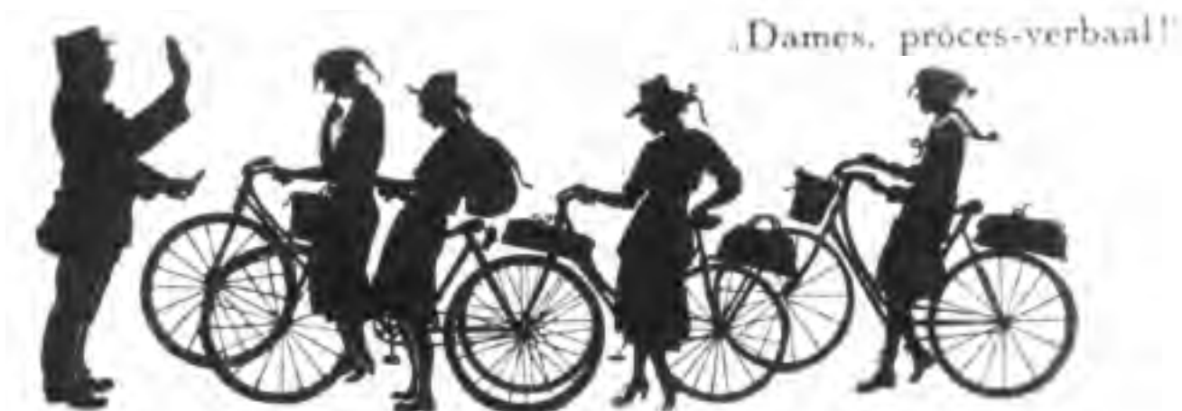
Uit: vier meisjes op de fiets