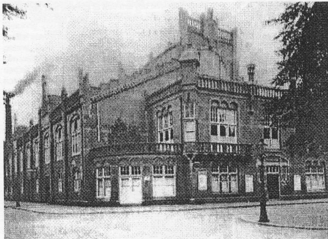
Het Zuiderbad in 1916.

De commissie bepleitte ook een betere benutting van de bestaande baden. Zij stelde voor de kleedhokjes uitsluitend te gebruiken voor het omkleden en de kleding te bewaren in kluisjes. Daarvoor gebruikte een bezoeker gedurende het gehele ▶