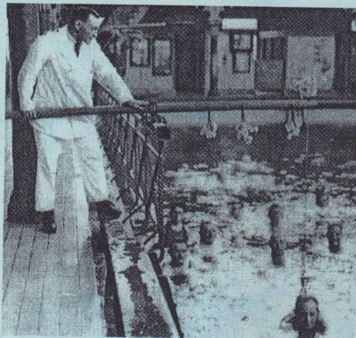
De geschiedenis van Amsterdamse zwembaden

'Wassen is goed, baden is beter, zwemmen 't best'