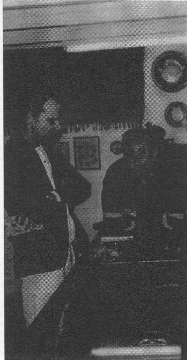
Foto: Jaco Treurniet (rechts) showt zijn verzameling aan redactielid Wilfred van Riieren

mooiste zou het natuurlijk zijn als de collectie straks permanent in het Olympisch Stadion van Amsterdam wordt tentoongesteld.