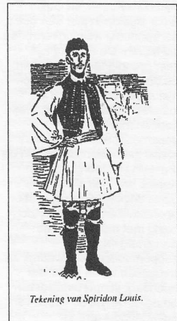
Tekening van Spiridon Louis.

Journal of Olympic History is een uitgave van The International Society of Olympic Historians (ISOH) en verschijnt drie maal per jaar. Een abonnement (inclusief lidmaatschap van de ISOH) kost 21 Euro per jaar. Aanmelding bij Anthony Bijkerk, Vogelrijd 10, 8428 HH Fochteloo