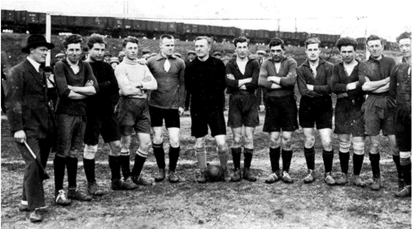
Het kampioenselftal van Scheveningen uit 1926.

een drankje of tijdens het Thé-dansant, luisteren naar de muziek van een strijkje, al dan niet vergezeld van een zanger, zangeres of humorist. Deze dansgelegenheden moeten aan strenge politievoorschriften voldoen, anders krijgen zij geen toestemming.