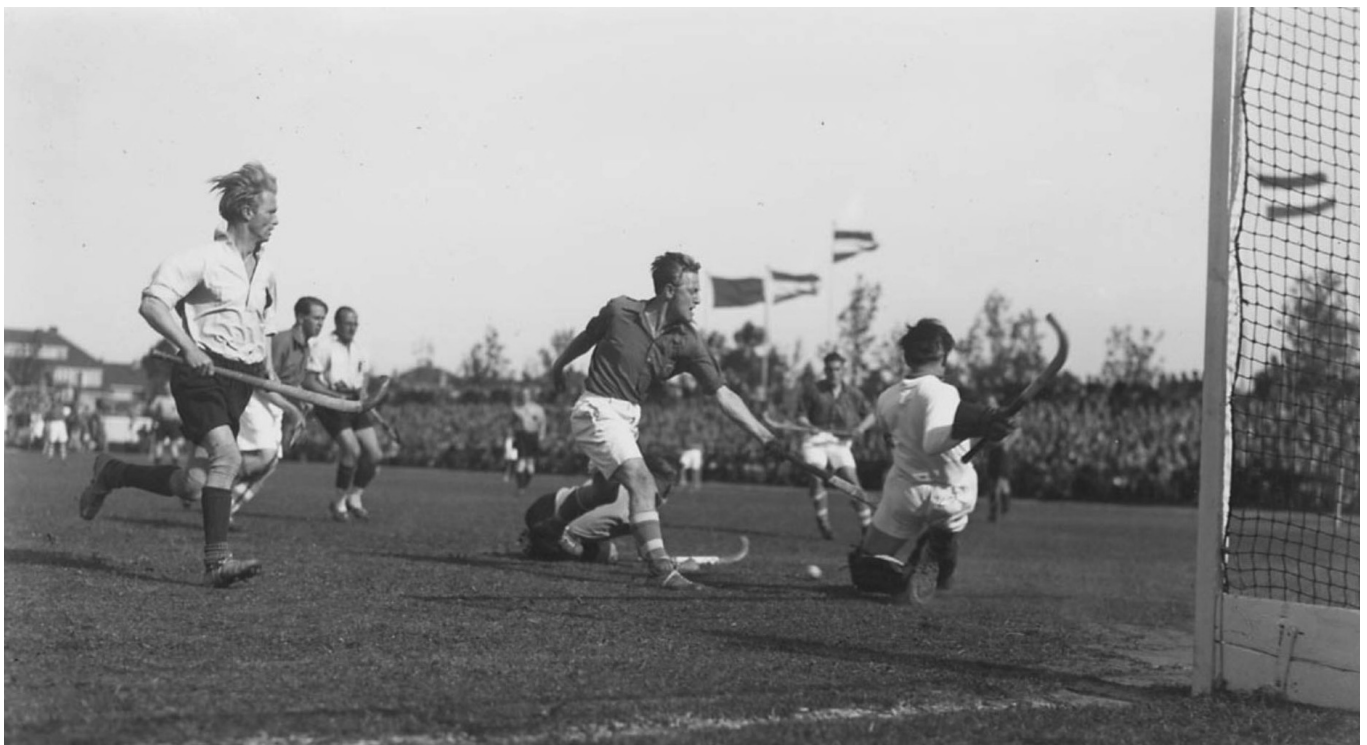
Hockeyinterland Nederland-België, Amstelveen 1946.