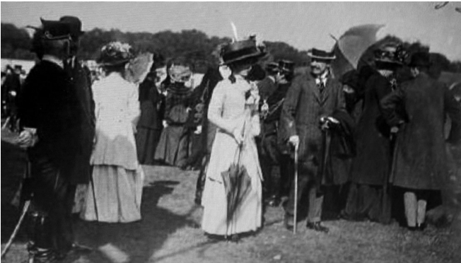
Toeschouwers bij een concours hippique in Zorgvliet, 1909.

De fleurigheid was er helemaal uit, dien eerste regenachtigen Dinsdag, en geen stafmuziek van het regiment huzaren, noch het verdienstelijke strijkje, dat de meest moderne wijsjes liet hooren, kon de stemming er in brengen.