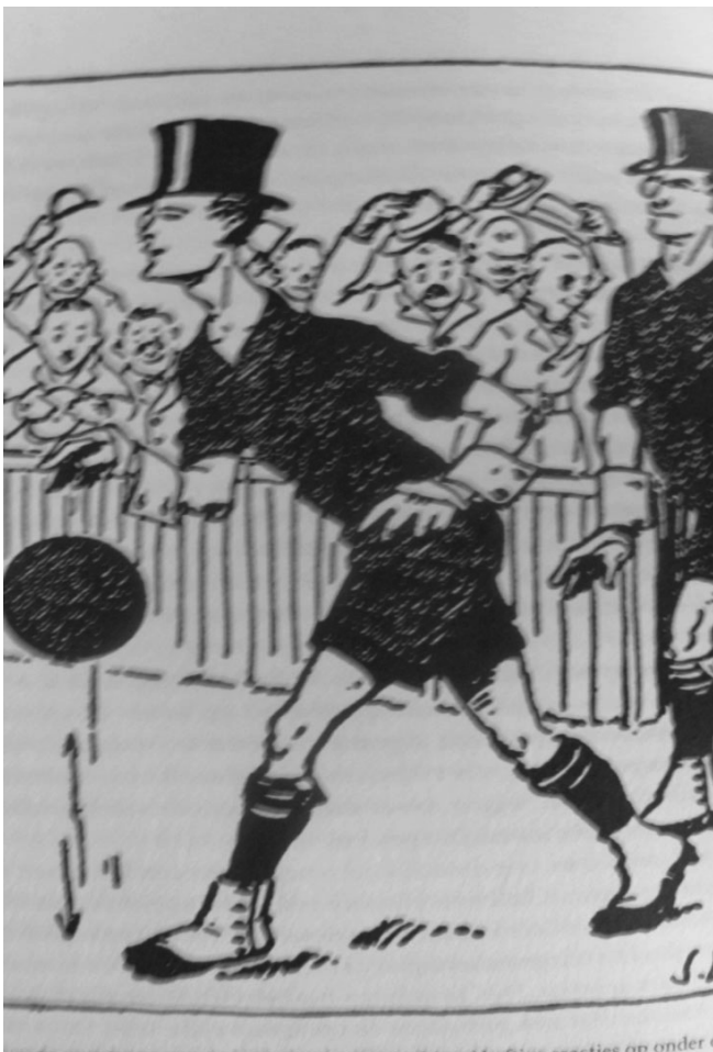
Een spotprent van de Nederlandse Corinthians Bron: Van Buuren en Mol, 2000'

In het Gedenkboek van 1929, hetwelk ik weer eens opsloeg, vind ik op blz. 161 eenige regels over ruw spel. Ik schrijf daar: 'de studeerende jeugd en de eerste standen gevoelen zich meer tot andere sporten aange trokken. Aan wie de schuld?, reeds 5 jaar geleden heb in rigoureuze maatregelen tegen zeer enkelen , die als gemeene, gevaarlijke spelers bekend staan aanbevolen,