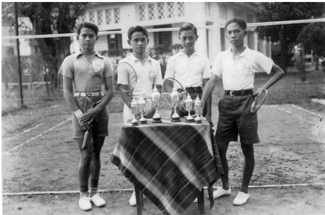
Chinese badmintonners met hun behaalde prijzen te Batavia, omstreeks 1940.

Bronnen voor Indische sportgeschiedenis zijn alleen aan te boren in kranten, tijdschriften en memoires. Maar dan doet zich het probleem van de beschikbaarheid van Indonesische stukken van vóór de oorlog voor. In het sportmuseum in Jakarta lijkt de sportgeschiedenis van Indonesië te beginnen in 1945, met een paar vooroorlogse aandachtspunten zoals de oprichting van de PSSI en de trip naar Frankrijk in 1938. Er lijkt een volledige breuk te zijn tussen Indië en Indonesië. En toch lopen de lijnen, zij het nu anders gekleurd, door. De meeste Indische bonden van vóór de oorlog zijn overgenomen, opgeslokt of gefuseerd met de Indonesische counterparts. De infrastructuur (stadions, clubgebouwen, trainingsfaciliteiten, pers en propaganda, samenwerking met stadsbesturen) zijn onveranderd overgenomen.