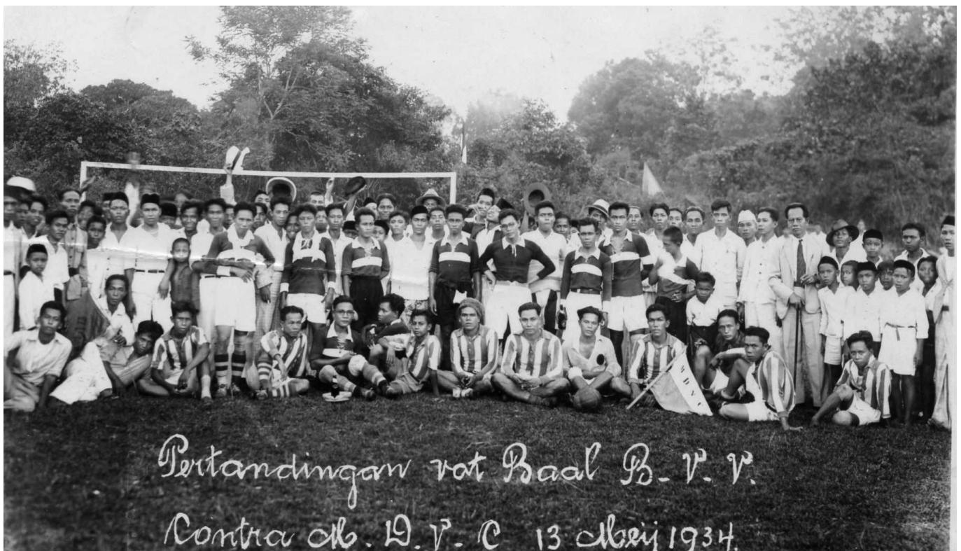
Twee Indonesische voetbalteams en hun aanhang (plaats onbekend) in 1934.

Het is historisch gesproken heel jammer dat van al de oorspronkelijke sportclubs in Indië bitter weinig is overgebleven. Een uitzondering is de voetbalclub BVC uit Batavia, die nog steeds bij elkaar komt, nu als reünistenvereniging in Nederland. Tot voor kort was ook de COOVI (Club van Oud Voetballers en Officials uit Indonesië) in Den Haag actief. ROKI (Reünisten en Oud Korfballers uit Indonesië) organiseert wel nog steeds wedstrijden.