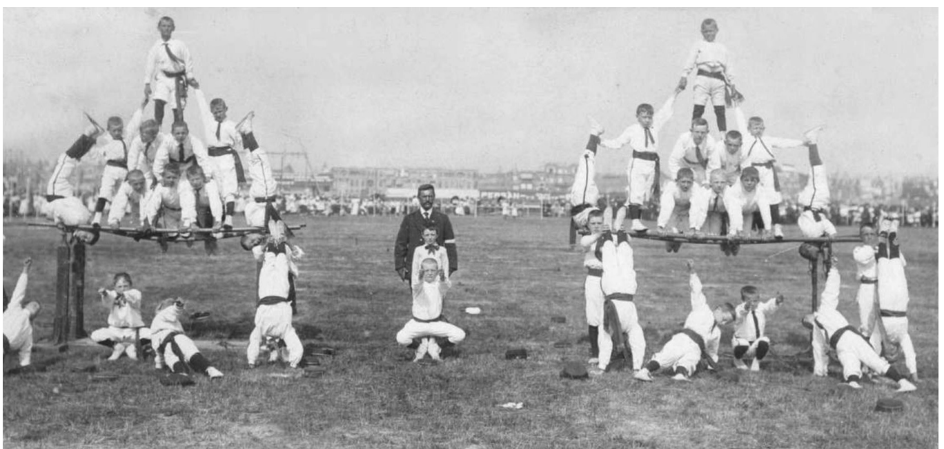
Internationale turnwedstrijd op Houtrust, 's-Gravenhage 1911.

In grote lijnen zou een programma voor Nederlandse sportgeschiedenis zich kunnen spiegelen aan het onderdeel Meedoen uit het Sectorplan Sportonderzoek en -onderwijs 2011|2016 7 en het daaruit voortgevloeide subsidieprogramma. 8 Een eigen plaats in een dergelijk programma leidt tot een verankering van het historisch onderzoek maar ook tot een verrijking van de andere onderdelen in dat programma.