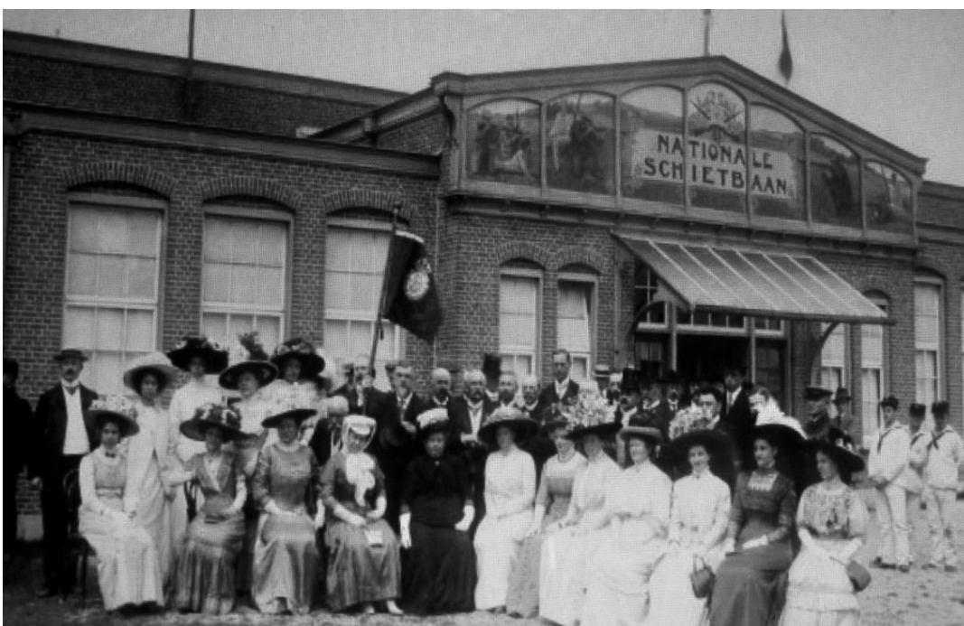
Publiek bij de 16de Nationale Schietwedstrijd op de Nationale Schietbaan in Loosduinen, 1915.

De in 1888 opgericht tennisvereniging Leimonias speelt aanvankelijk op De Bataaf. De Haagse chroniqueur Gram schrijft in 1893 over het tennis op De Bataaf: